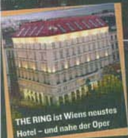
THE RING ist Wiens neuestes Hotel – und nahe der Oper