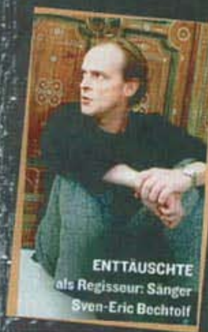
ENTTÄUSCHTE als Regisseur: Sänger Sven-Eric Bechtolf