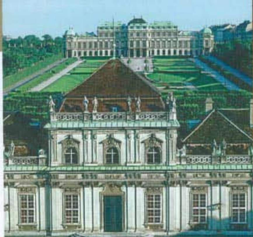
PRINZ EUGEN von Savoyen hat das Belvedere erbaut ...